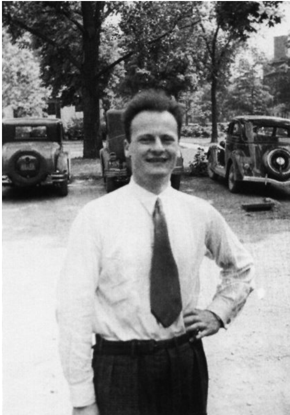
Cowok keren kita, Hans Bethe

Bethe juga menjadi ilmuwan pertama yang berhasil menjelaskan fenomena Lamb shift dalam spektrum hidrogen. Menurut cerita, pada tahun 1947 di Shelter Island dekat New York diadakan suatu konferensi fisika yang dihadiri oleh semua tokoh fisika kelas wahid masa itu seperti Schwinger, Feynman dan Bethe. Ditempat ini mereka