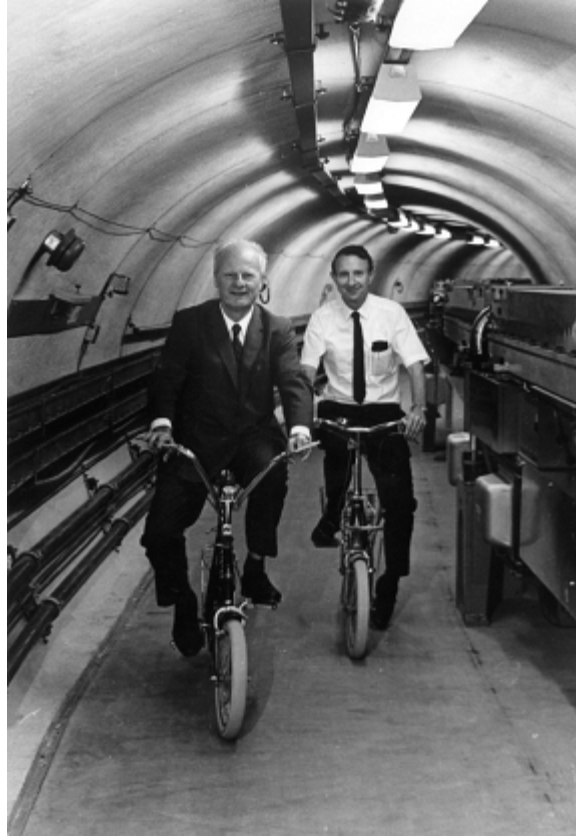
Hans Bethe di Cornell Electron Storage Ring,

Rutherford dan Fermi sebelum pindah ke Amerika saat Cornell University menawarkannya jabatan Asisten Profesor pada tahun 1934. Ia resmi menjadi warga negara Amerika pada tahun 1941.