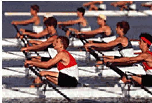
Gambar 1 Perlombaan mendayung sebagai suatu bentuk olahraga

Olahraga dayung semula dikenal sebagai suatu cara transportasi dan penyelamatan diri selama masa peperangan di laut. Negara-negara seperti Yunani dan Viking dikenal dengan perahu-perahu dayungnya yang dikemudikan oleh banyak pedayung handal (mencapai 30 pedayung dalam 1 perahu). Kegiatan mendayung ini mulai dijadikan suatu bentuk olahraga di River Thames, Inggris. Sejak saat itu olahraga dayung menjadi olahraga paling populer di Inggris. Berbagai perkembangan dalam teknik mendayung ternyata didasari oleh berbagai konsep fisika yang diaplikasikan dalam olahraga ini.