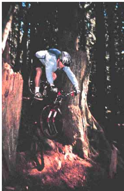
Gb. 5 Gravitasi dapat mendorong sepeda turun.

Gaya gravitasi memegang peranan penting saat pengendara sepeda melewati bukit. Gaya ini menarik kita ke bawah. Kita harus memberikan ekstra energi untuk melawan gravitasi ini ketika kita hendak menanjak bukit. Semakin tajam tanjakan bukit semakin besar energi yang dibutuhkan untuk menaiki tanjakan ini. Namun ketika kita menuruni bukit, gravitasi menjadi faktor yang berguna. Gravitasi mendorong sepeda turun lebih cepat.