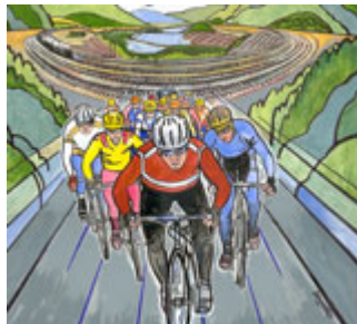
Gb. 4 Drafting

( arus eddy ) yang tercipta tepat di belakang pengendara terdepan untuk menarik pengendara berikutnya sehingga energi yang dibutuhkan menjadi lebih kecil (mirip dengan gerakan migrasi angsa yang membentuk huruf V pada artikel minggu lalu). Semakin kecil jarak antara pengendara terdepan dengan pengendara berikutnya semakin efisien penggunaan energi oleh kedua pengendara. Pengendara terdepan dibantu oleh penggunaan arus eddy oleh pengendara berikutnya walaupun total energi yang dikeluarkan tetap lebih besar dari energi yang dikeluarkan pengendara yang berada tepat di belakangnya. Formasi bersepeda yang membentuk grup semacam ini dikenal sebagai formasi peloton dan echelon (formasi menyamping ke kiri maupun kanan). Para pengendara yang membentuk formasi semacam ini dapat menghemat energi sampai 40%. Pengendara sepeda profesional bahkan melakukan drafting pada jarak beberapa cm saja untuk menghemat energi.