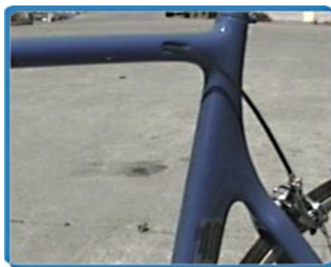
Gb. 3. Desain kerangka sepeda yang aerodinamik.

Selain penempatan posisi tubuh yang baik, desain roda dan kerangka sepeda yang tepat juga dapat mengurangi tahanan udara. Kerangka sepeda yang berbentuk bulat digantikan oleh rancangan bentuk yang oval, sementara bentuk roda yang bergerigi digantikan oleh bentuk cakram ( disc ) yang dapat memperkecil turbulensi (gejolak udara) dan drag force saat berputar.