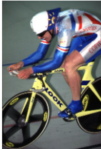
Gb. 2 membungkukan tubuh agar lebih aerodinamik

tetapi justru berada teknik untuk memaksimalkan efisiensi aerodinamik yang dapat dicapai.