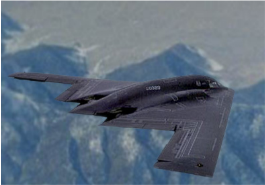
Gambar 2 Flying Wing khusus keperluan militer ( B-2 Bomber )

Sebenarnya alasan utama yang melandasi ide untuk mengaplikasikan desain yang biasa digunakan untuk keperluan militer ini adalah semakin melonjaknya jumlah penumpang pesawat terbang setiap harinya. Alat transportasi udara ini semakin digemari karena memungkinkan kita untuk berkeliaran di seluruh dunia dalam waktu cepat. Perhitungan yang dilakukan oleh Federal Aviation Administration (FAA) menunjukkan bahwa lonjakan penumpang diperkirakan dapat mencapai 63% dari tahun 2000 sampai 2012. Ini berarti volume penerbangan setiap harinya mesti ditingkatkan. Industri penerbangan dunia harus cepat-cepat memutar otak supaya dapat memenuhi kebutuhan transportasi udara ini. Yang pasti, penambahan jumlah penerbangan per hari tidak banyak menyelesaikan masalah. Karena kita sendiri sering mengalami terjadinya penundaan jadwal penerbangan, bahkan pembatalan penerbangan. Diperlukan suatu solusi lain yang dapat membantu menyelesaikan permasalahan ini. Ini saatnya para fisikawan menyumbangkan keahliannya!