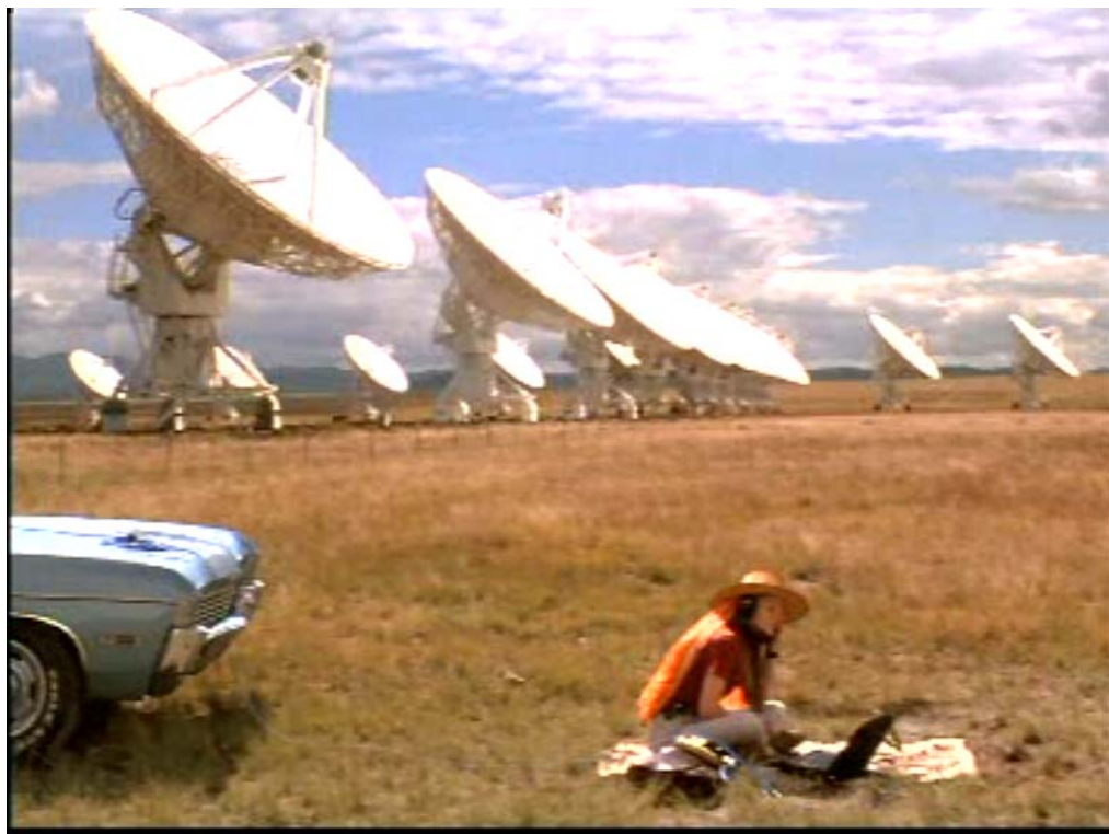
Gambar 4 Radiotelescope dalam salah satu adegan film Contact

Alat penerima gelombang mikro yang paling sensitif adalah radiometer. Jika radiometer diarahkan ke langit, alat ini bisa berfungsi sebagai radiotelescope (teleskop yang menangkap transmisi gelombang radio). Dua radiotelescope yang paling besar adalah Arecibo di Puerto Rico dan Very Long Baseline Array (VLBA) di New Mexico. Keduanya sangat terkenal dan pernah membintangi film Contact (Jodie Foster) sebagai alat penerima gelombang mikro yang ditransmisikan oleh makhluk luar angkasa!