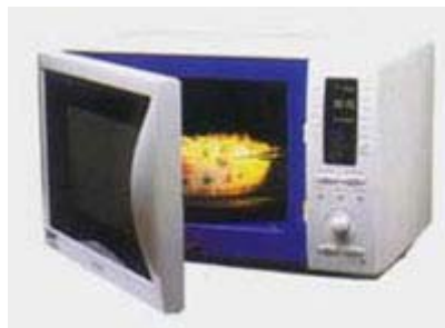
Gambar 2 Ini bukan Microwave , tetapi Microwave Oven

Microwave oven sendiri bisa bekerja begitu cepat dan efisien karena gelombang elektromagnetiknya menembus makanan dan mengeksitasi molekul-molekul air dan lemak secara merata (tidak cuma permukaannya saja). Gelombang pada frekuensi 2.500 MHz (2,5 GHz) ini diserap oleh air, lemak, dan gula. Saat diserap, atom tereksitasi dan menghasilkan panas. Proses ini tidak memerlukan konduksi panas seperti di oven biasa. Karena itulah prosesnya bisa dilakukan sangat cepat. Hebatnya lagi, gelombang mikro pada frekuensi ini tidak diserap oleh bahan-bahan gelas, keramik, dan sebagian jenis plastik. Bahan logam bahkan memantulkan gelombang ini. Ini memberi kesan microwave oven adalah oven pintar yang bisa memilih untuk memasak hanya makanannya saja, bukan wadahnya.