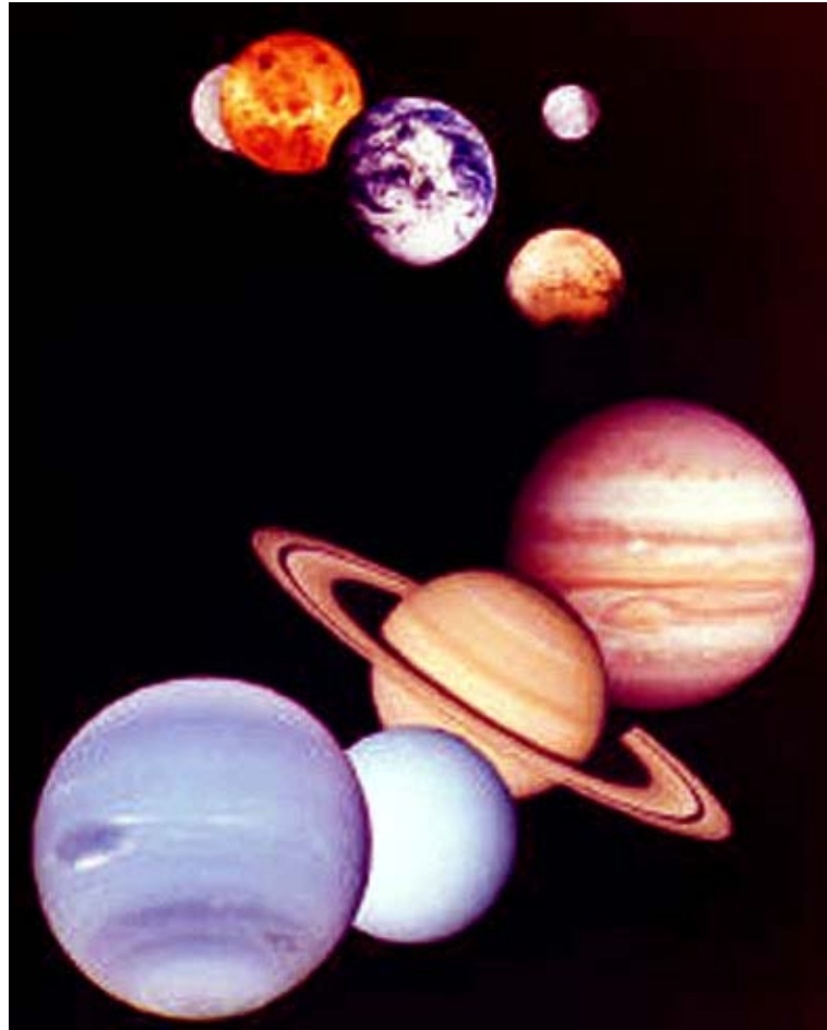
Gambar 1 Planet-planet dalam sistem tatasurya kita

Komet dan asteroid yang berseliweran dalam sistem tatasurya kita dapat menabrak bumi dan memusnahkan kehidupan di planet kita. Untung saja sistem tatasurya kita memiliki satu planet raksasa, Jupiter, yang gaya gravitasinya begitu besar sehingga selalu menarik komet dan asteroid yang berseliweran itu. Hasilnya, komet dan asteroid yang sedang bergerak dalam kecepatan tinggi justru pecah berkeping-keping akibat gaya tarik gravitasi Jupiter sehingga pecahannya tidak lagi berbahaya bagi planet bumi.