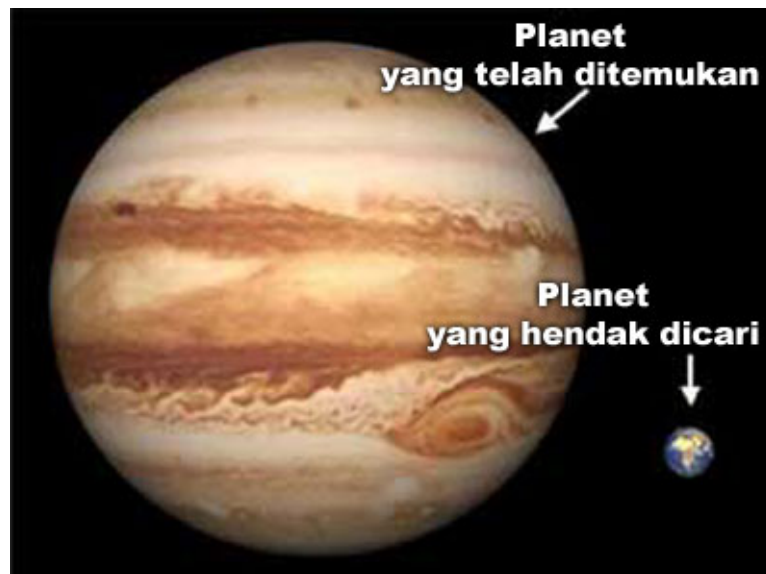
Gambar 3 Perbandingan ukuran planet yang telah ditemukan vs yang kita cari

Dengan ketiga konsep sederhana tadi, ilmuwan-ilmuwan sudah berhasil menemukan banyak planet di luar sistem tatasurya kita. Sayangnya, planet-planet tersebut merupakan planet-planet raksasa seukuran Jupiter, bahkan ada yang besarnya sampai lima kali lebih besar dari Jupiter. Ini disebabkan, planet yang kecil terlalu susah untuk dideteksi. Analoginya seperti berusaha melihat (dari bumi) seorang astronot yang sedang berada di bulan. Efek gaya gravitasi planet tersebut terhadap bintang terlalu kecil untuk dideteksi. Begitu pula perubahan intensitas cahaya bintang akibat revolusi planet. Perubahannya terlalu kecil untuk dideteksi. Padahal yang kita butuhkan justru planet-planet yang mirip planet bumi yang dapat mendukung kehidupan. Bagaimana cara Fisika memecahkan masalah ini?