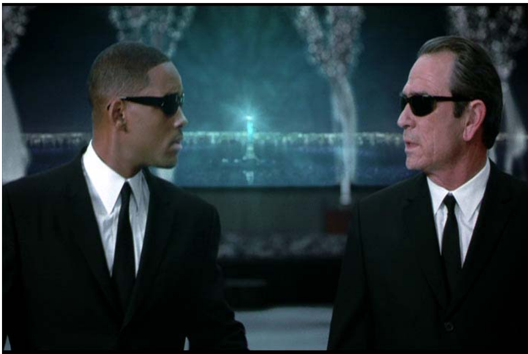
Gambar 1 Sunglasses untuk melindungi si pemakai (Film Men in Black II )

Apa yang menyebabkan terjadinya perbedaan harga yang sedemikian? Apakah harga mahal hanya disebabkan nama beken sang perancang? Apa sebenarnya rahasia yang tersembunyi di balik benda kecil yang sering memberi kesan misterius pemakainya ini?