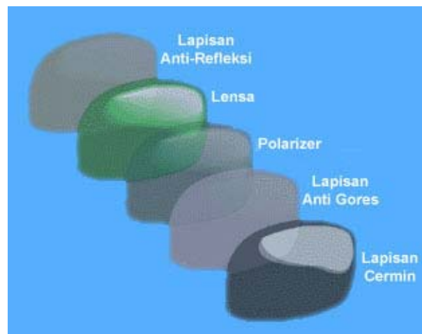
Gambar 4 Lapisan-lapisan pada sunglasses

Sunglasses yang baik umumnya memiliki lapisan-lapisan (Gambar 4) yang terdiri dari lapisan anti refleksi (anti pantul) yang dilekatkan di bawah lensa, polarizer yang dioleskan di atas permukaan lensa, serta dilengkapi lagi dengan lapisan pelindung yang anti gores dan lapisan cermin untuk memantulkan kembali gelombang cahaya yang mendekati mata.